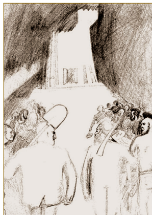
Рисунок Александра Танхилевича

Но в шестидесятую годовщину молодой древней страны, глубокий кризис охвативший подобно раковой опухоли все сферы государственного организма, безжалостно разрушает саму основу существования еврейского национального дома. Ослабленный Израиль, устоявший в схватке с внешними врагами и некогда побеждавший своих недругов на поле брани, оказывается ныне не способен противостоять даже мелким вражеским