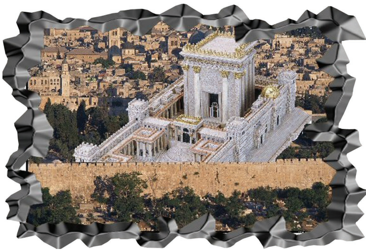
Коллаж Ирис Мерсель

Безусловно найдутся те, кто патетически укажут на вопиющее несовершенство сегодняшнего Израиля, его несоответствие мечтам и чаяниям предыдущих поколений, вопрошая – следует ли нам торопиться с созданием Храма, который в той же степени окажется несоответствующим сияющему идеалу, бережно вынашиваемому в сердцах нынешних приверженцев идеи. И мы безусловно должны ответить на это твердо – да, следует! Каким бы несовершенным не был бы современный Израиль, он несравнимо лучше несуществующего вовсе! Именно так, через труд нации, через упорное преодоление недостатков сегодняшнего государства мы приближаемся к идеалу. Потому что, невозможно приблизиться, не имея хотя бы и несовершенной модели.