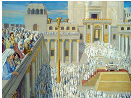
Из собрания Института Храма (Махон аМикдаш)

нимались попытки возродить Всесобрание (не саму заповедь, конечно, а напоминание о ней). У Западной стены или в Главной Иерусалимской синагоге собирались евреи в первый день холь-а-моэд Суккот и разные лица играли роль царя-чтеца Торы. Среди них были главный кантор, Главный Раввин, уважаемый Рош Йешива. Семь лет назад дошли, казалось бы, до самого близкого к оригиналу – Тору читал сам Президент